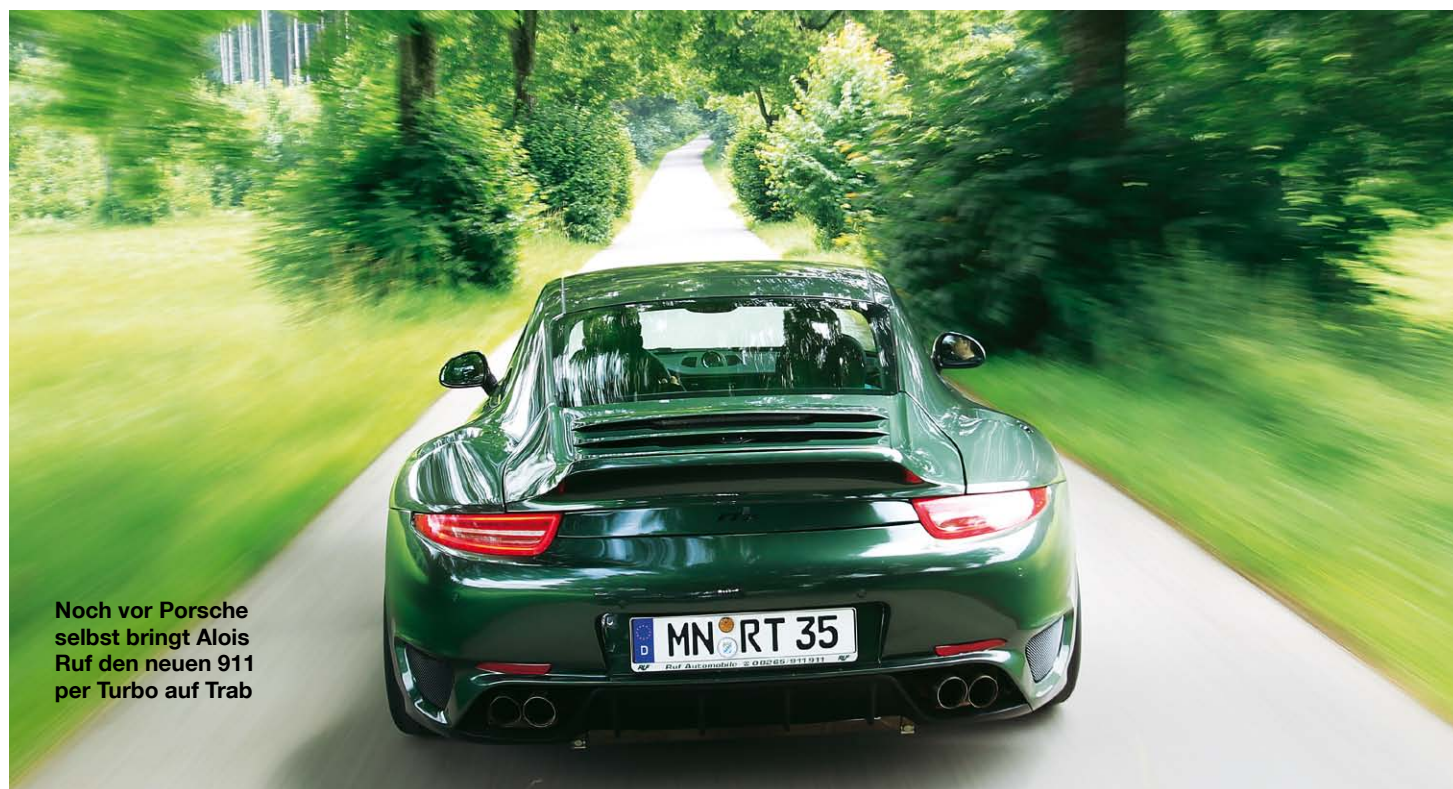
Noch vor Porsche selbst bringt Alois Ruf den neuen 911 per Turbo auf Trab